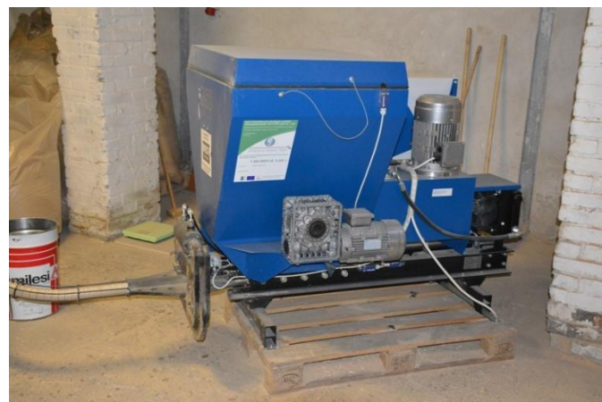
Újszentiván, 2015. február 26.